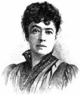
Bertha v. Suttner